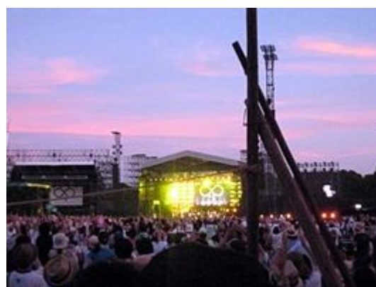
ap bank fes '10 の様子