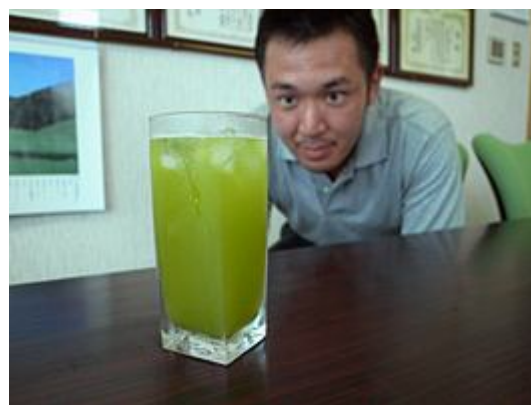
筆者含めみんなで打ち合わせ中!?

また、当日の様子等につきましては終了後報告させていただきます。あとは開催3日間を通し雨が降らず天気が良いことを祈ります(>人<*)。